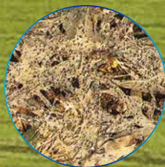
雪腐黒色小粒菌核病