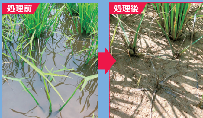
2024年 福島県大玉村圃場(日産化学社内試験) 散布日:レブラスギア1キロ粒剤 6/18(オモダカ矢尻葉3~4葉) 調査日:7/23(処理35日後)